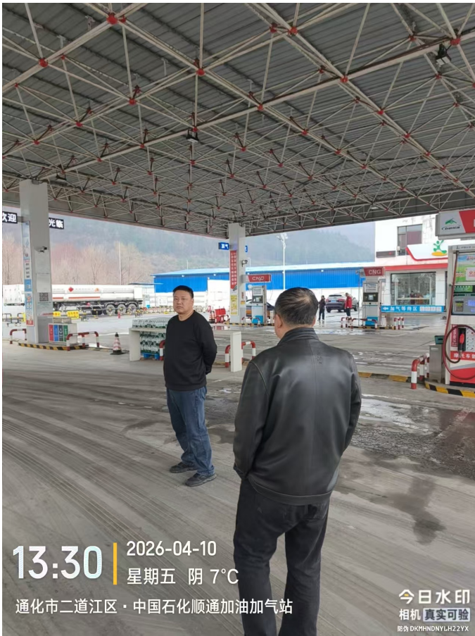
13:30 | 2026-04-10 星期五 阴 7°C 通化市二道江区·中国石化顺通加油加气站