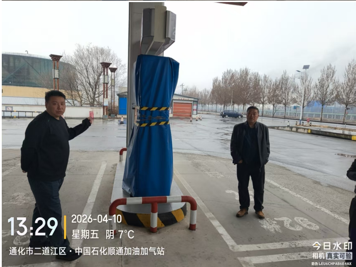
13:29 | 2026-04-10 星期五 阴 7°C 通化市二道江区·中国石化顺通加油加气站