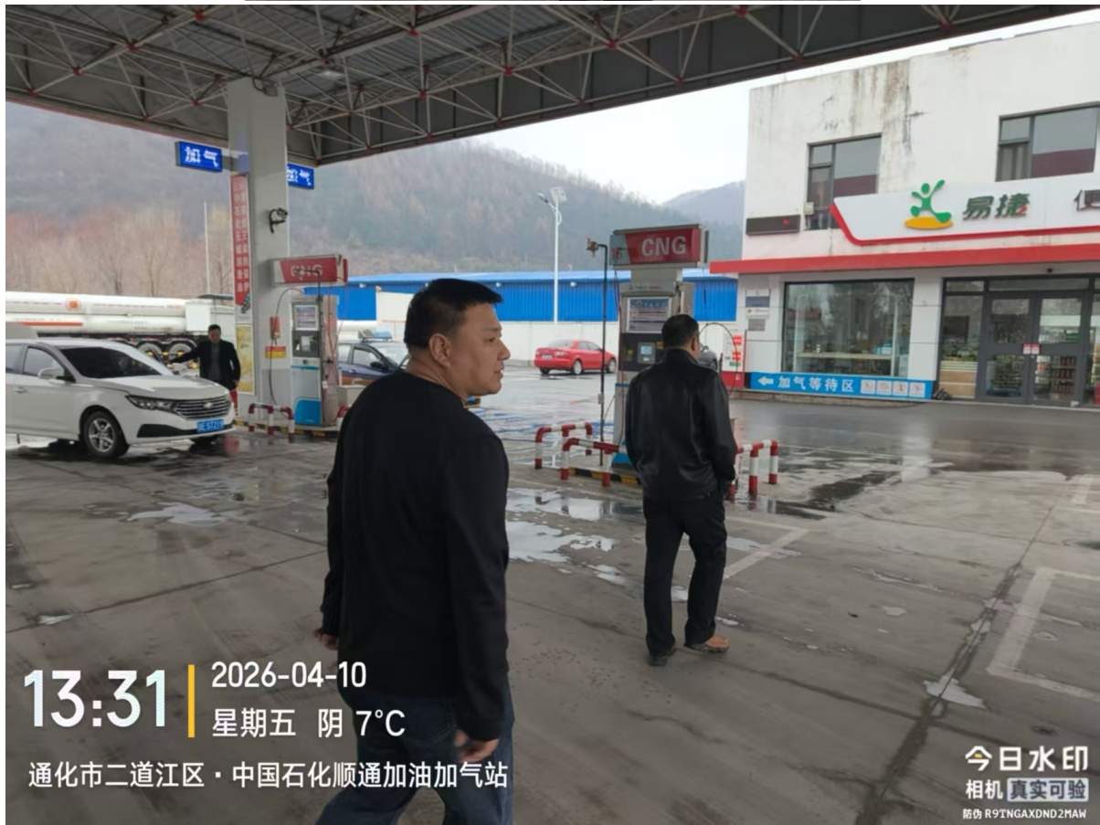
13:31 | 2026-04-10 星期五 阴 7°C 通化市二道江区·中国石化顺通加油加气站